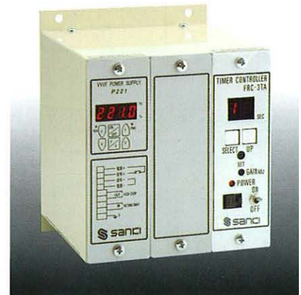
システムの一例 An example of system